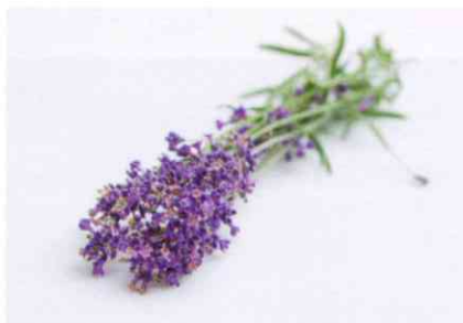
Ätherische Öle aus der Lavendelpflanze dienen der Herstellung von Farben und Lasuren.