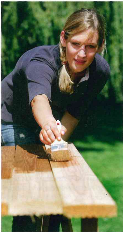
Das Terrassenöl wird mit einem Pinsel aufgetragen und verhilft den Holzdielen zu neuem Glanz.

sen, dass es in diesem Bereich auch anders geht. Dabei setzte er auf das Wissen früherer Generationen, das er konsequent weiterentwickelte. Mithilfe seiner Mitarbeiter gelang es ihm schließlich, moderne leicht zu verarbeitende Farben herzustellen, ohne Erdöl als Rohstoff zu benötigen.