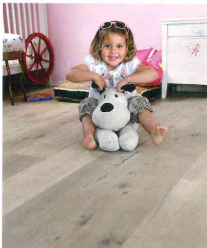
Da die Wandfarben von Auro lösemittelfrei sind, sind sie ideal für Kinderzimmer.