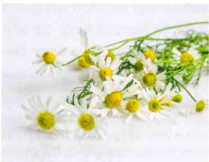
In diversen Reinigungs- und Pflegemitteln von Auro findet sich ein alkoholischer Auszug aus den Blüten der Kamille.