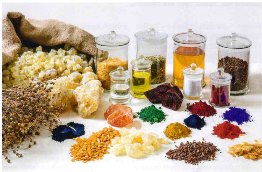
Die Farben von Auro werden überwiegend auf pflanzlicher Basis hergestellt. Im Fokus stehen die Herkunft der Rohstoffe und ihre nachhaltige Erwirtschaftung.

dabei zur Produktion der wohngesunden Farben verwendet. Besonderer Wert wird in diesem Zusammenhang auf die Herkunft und Nachhaltigkeit der Rohstoffe gelegt, Land- und Forstwirte sind die Grundstoffproduzenten. Diese Abkehr von erdölabhängigen Farben ist – abgesehen von (wohn-)gesundheitlichen Aspekten – ein großer Schritt hin zu einem nachhaltigen und zukunftsfähigen Wirtschaften. Ein Weg, den viele Firmen noch vor sich haben: weg von fossilen Grundstoffen hin zu solareren. Diese Abkehr von erdölabhängigen Farben und Lacken, die letztlich auf einem