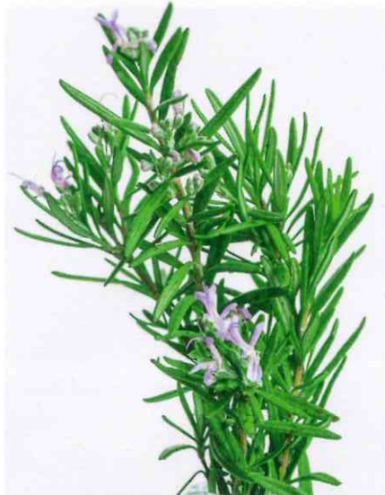
Das aus Rosmarin gewonnene Öl ist Bestandteil mehrerer Farben, Reiniger und Pflegemittel.