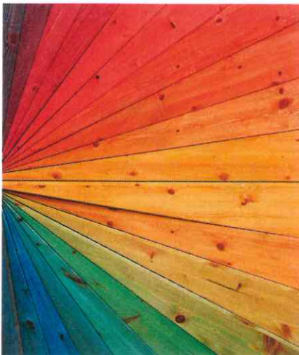
Dank einer breiten Farbpalette findet sich für jedes Ambiente der richtige Holzanstrich.