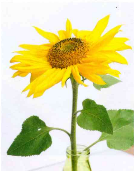
Die Samen der Sonnenblume spenden Öl für die Herstellung von Lacken, Farben und Seifen.