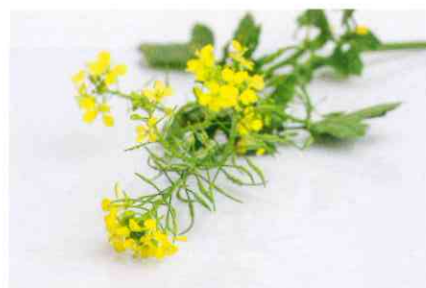
Rapstenseide helfen bei der Produktion eines lösemittelfreien Öl-Harz-Bindemittels.