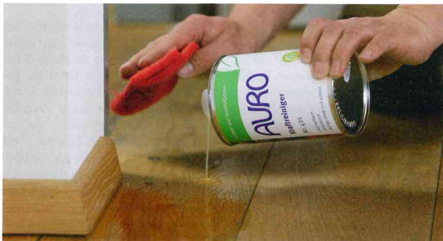
Mit dem Kraftreiniger können stark verschmutzte Holzoberflächen geputzt werden. Er eignet sich für gewachste Holz-, Parkett-, Cotto- oder Korkböden.

einzigsten – und dazu endlichen – fossilen Rohstoff basieren, öffnet den Weg zu einer Vielfalt erneuerbarer Pflanzenstoffe. Das ist für eine Firma, die Anstrichstoffe und Reinigungsmittel produziert, fast einmalig. Zwar zählt Auro zur chemischen Industrie: Dadurch, dass aber ihre Produkte überwiegend auf pflanzlicher Basis hergestellt werden und der