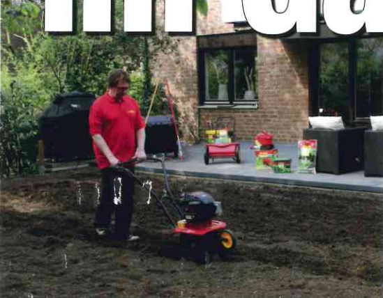
Rasen anlegen: Schritt für Schritt